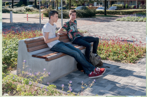
bank - verblijfsplek