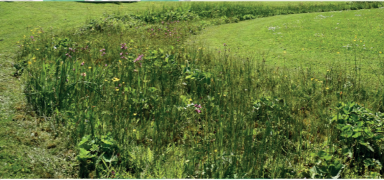
wadi-achtige situatie met beplanting