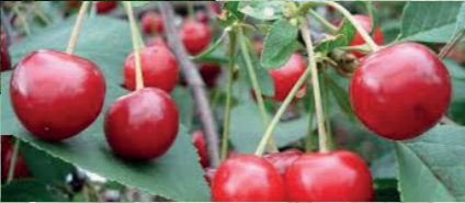
fruit bloesem (kers)