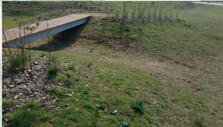
'plank over de sloot