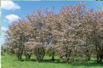
heesters met sierwaarde (krentenboompje op nattere delen, vlinderstruik droger)