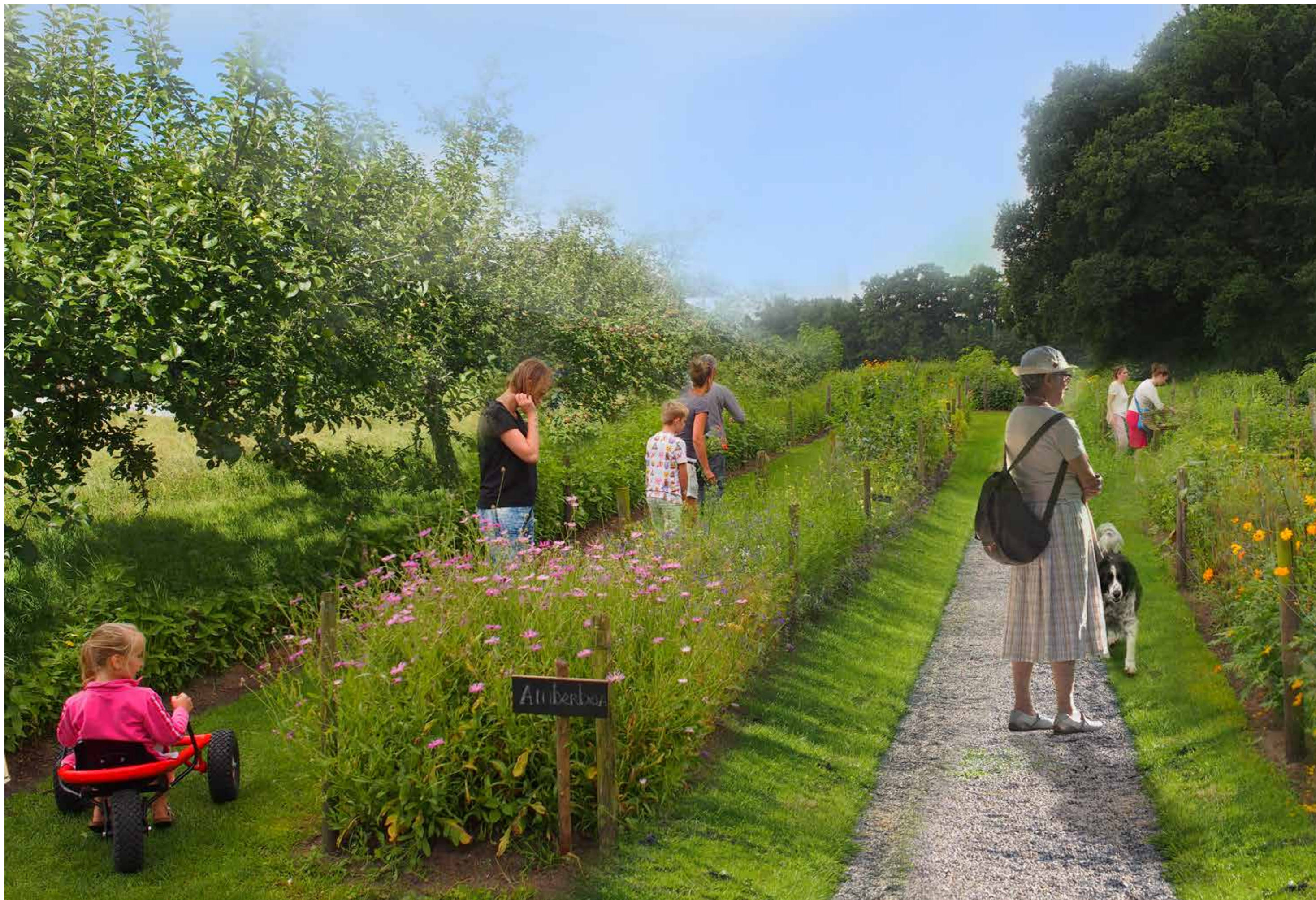
impressie beleef tuin