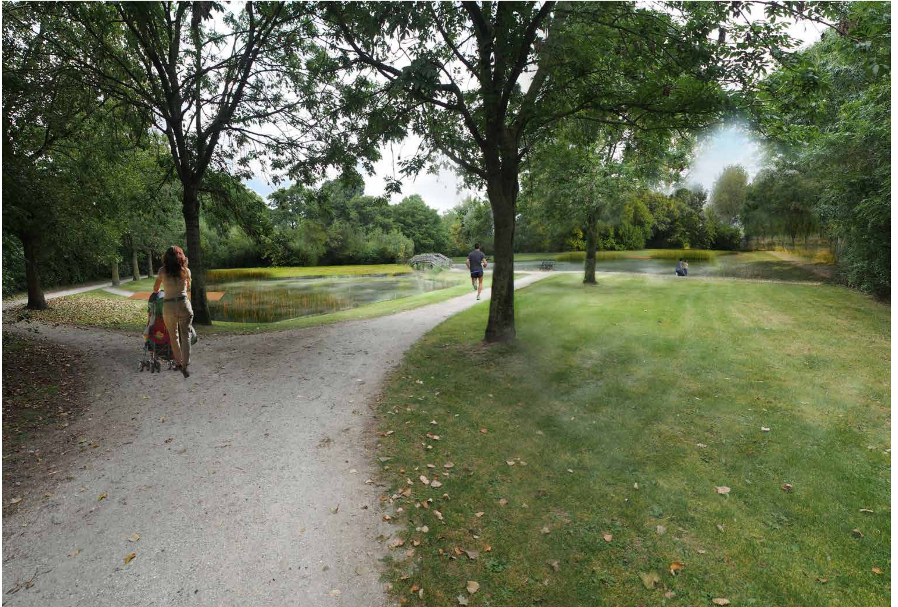
impressie opgeknapt park